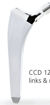
CCD 127° links & rechts