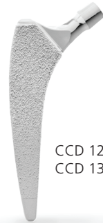
CCD 127° (standard) CCD 135° (valgus)