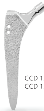
CCD 127° (standard) CCD 135° (valgus)